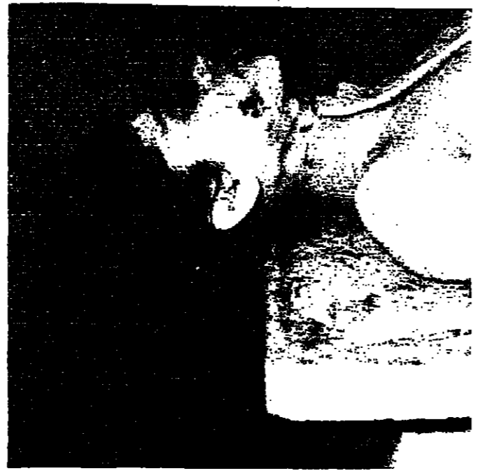
القتيلة المجهولة في العبادية